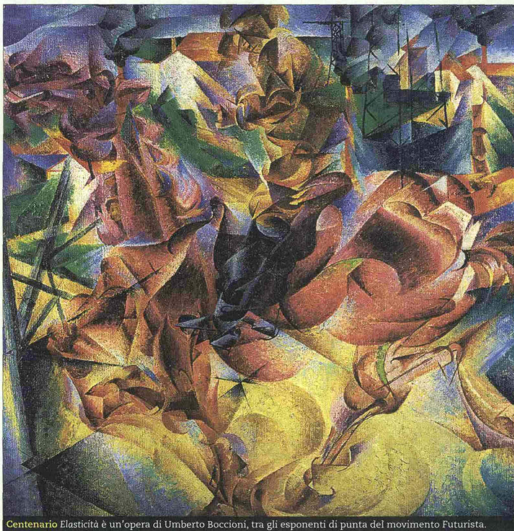
Centenario Elasticità è un'opera di Umberto Boccioni, tra gli esponenti di punta del movimento Futurista.

Il Futurismo compie cent'anni, mentre Venezia guarda al Mediterraneo e Capossela fa il mago.